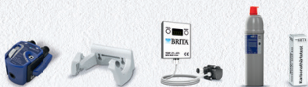
PURITY C150 Quell ST Starter Set 4