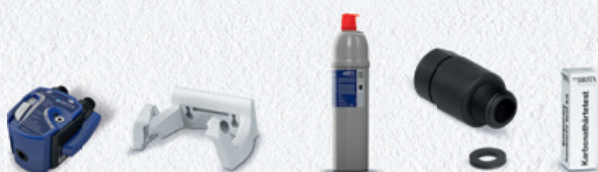
PURITY C150 Quell ST Starter Set 5