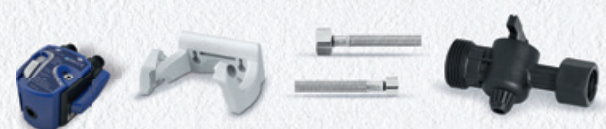
PURITY C Filterkopf Set I 0 – 70 %