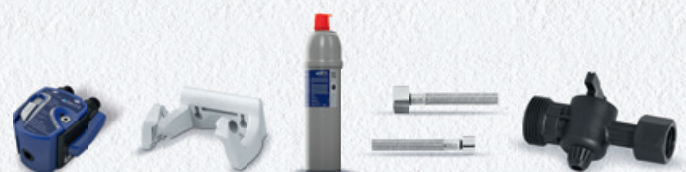
PURITY C150 Quell ST Starter Set 2