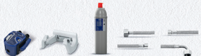
PURITY C300 Quell ST Starter Set 9