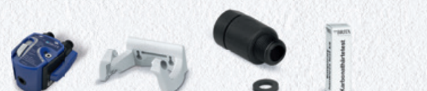
PURITY C Filterkopf Set III 0 – 70 %