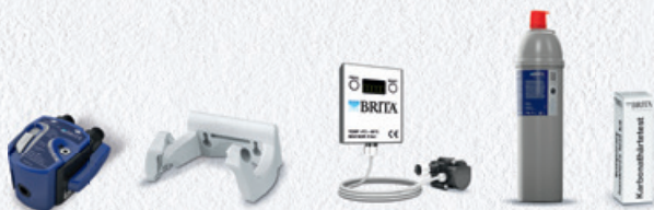
PURITY C300 Quell ST Starter Set 7