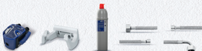
PURITY C150 Quell ST Starter Set 8