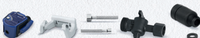
PURITY C Filterkopf Set VI 0 %