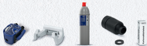
PURITY C300 Quell ST Starter Set 6