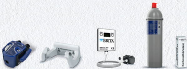
PURITY C500 Quell ST Starter Set 10